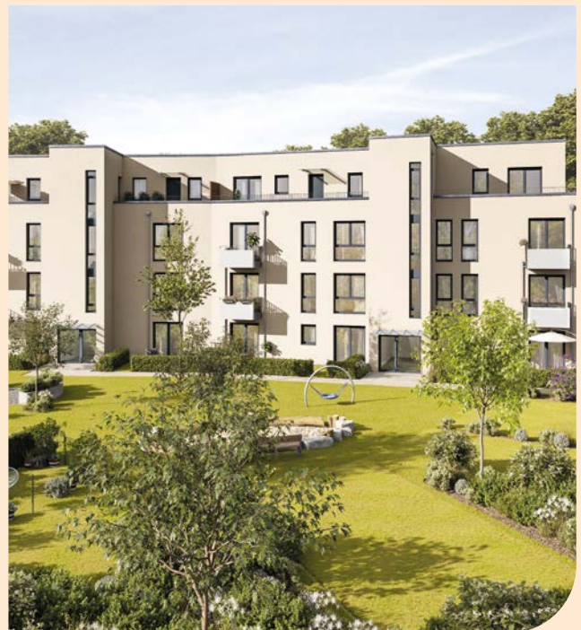
Oraniendamm 1-3, Berlin Reinickendorf