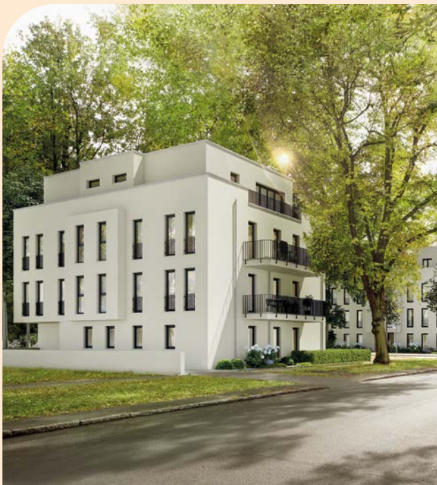
Baseler Straße 125/127, Berlin Steglitz-Zehlendorf

Das Investitionsportfolio konnte weiterhin risikobewusst und gezielt ausgebaut werden. Die positiven Marktbedingungen an den Standorten lassen auch für die Zukunft einen aussichtsreichen Entwicklungsverlauf erwarten. Die Immobilienentwicklungen befinden sich überwiegend in der Planungsphase. Hier wird intensiv an der Genehmigungsplanung gearbeitet, um mit Erteilung der Baugenehmigung zügig in die Vermarktung und weitere Realisierung starten zu können. In Friedrichshain-Kreuzberg ist am Ende des zweiten Halbjahres 2019 das Berliner Wohnbauvorhaben Baruther Straße und im Dezember 2019 in München das Mehrfamilienhaus an der Landsberger Straße in die Vermarktung gegangen. Bei dem Berliner Wohnobjekt Waidmannsluster Damm, dessen Vermarktungsstart im zweiten Halbjahr 2019 stattfand, erfolgte bereits der Baustart. Gleiches gilt für die Berliner Wohnanlage am Oraniendamm im Bezirk Reinickendorf. Mit dem Spezialtiefbau konnte beim gut vermarkteten Mehrfamilienhaus in der Baseler Straße, im Berliner Bezirk Steglitz-Zehlendorf, begonnen werden. Für die in Planung befindlichen Objekte laufen die Vorbereitungsarbeiten, um eine zügige Vermarktungs- und Baureife zu erlangen.