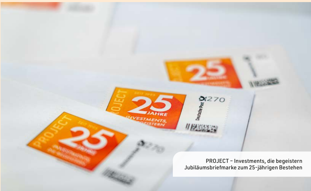
PROJECT - Investments, die begeistern Jubiläumsbriefmarke zum 25-jährigen Bestehen